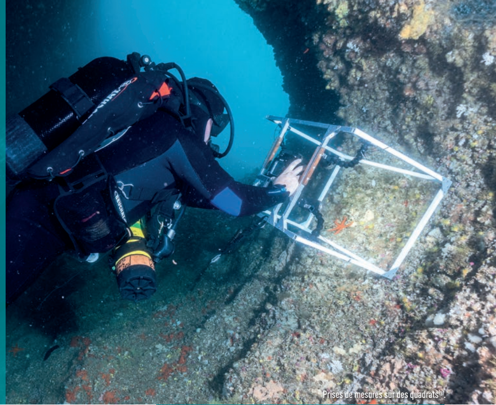
Prises de mesures sur des quadrats (3) .

La plongée scientifique se développe à grande vitesse ces dernières années pour répondre aux besoins d'acquisition de connaissances pour la recherche et du contrôle de l'état écologique des espaces maritimes. Même si elle est surtout menée par les scientifiques et universitaires, elle fait quelquefois appel aux plongeurs récréatifs à travers les séances participatives. Par Patrick Ragot.