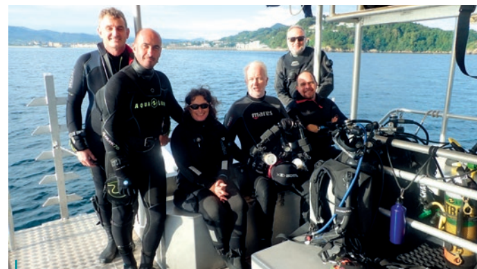
L'équipe au complet.

Pour ces plongées avec l'Ifremer, nous avons utilisé ces tables (et du coup pensé à mettre notre ordinateur en mode chronomètre!) pour la gestion de la désaturation